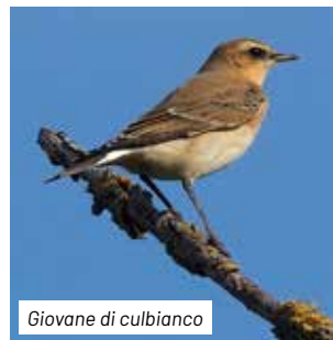
Giovane di culbianco

un breve tratto in quota, si scende con piccoli tornanti scoscesi, che si snodano ad un certo punto sotto un caratteristico arco naturale, che porta all'ingresso della Grotta di monte Cucco (1390 m), sulle cui pareti vegeta la rara primula orecchia d'orso ( Primula auricula ). Dalla piazzola antistante l'imbocco della grotta, lo sguardo si perde sull'orizzonte fino a vedere, in giornate limpide, il mar Adriatico. In primo piano a sud est si riconoscono monte Lo Spicchio e monte Culumeo con interposta la valle di S. Pietro. L'itinerario prosegue quindi lungo il sentiero 226 fino al punto di partenza.