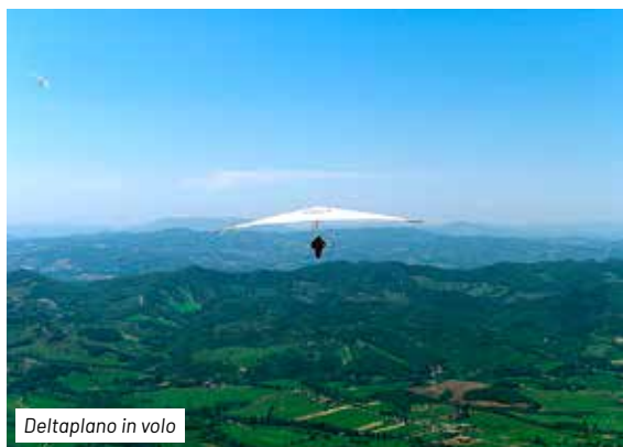
Deltaplano in volo

Dopo una breve sosta alla fonte Ghiacciata, sorgente di origine carsica dove ci si può rifornire di acqua, si prosegue sempre lungo il sentiero 240 fino ad incrociare il 226, che sale dalla Val Rachena. L'itinerario non