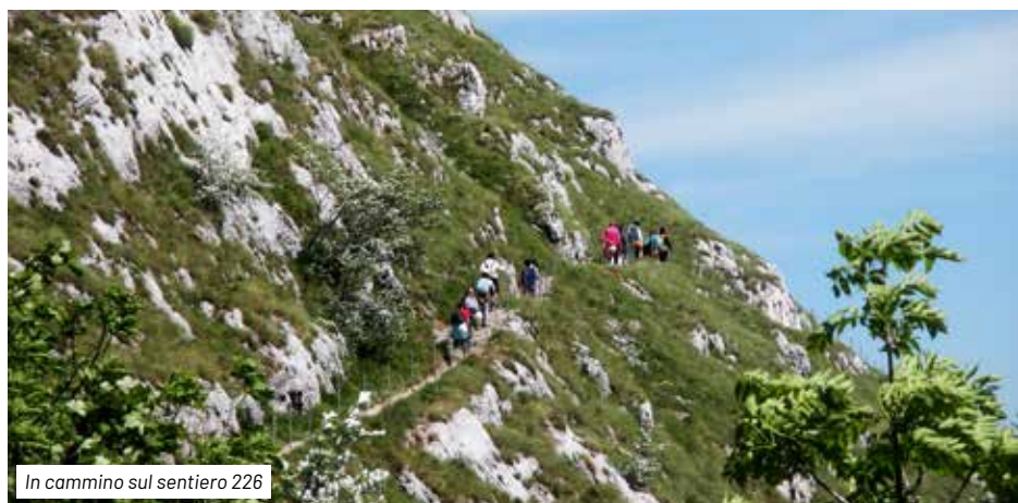
In cammino sul sentiero 226

devia in discesa verso Pian delle Macinaie, ma continua girando attorno alla vetta del Cucco, penetrando in un fresco bosco di faggio, cui si associano acero e sorbo montani nello strato arboreo, pungitopo ( Ruscus aculeatus ), bucanave ( Galanthus nivalis ), scilla ( Scilla bifolia ), croco ( Crocus vernus ) ed aglio orsino ( Allium ursinum ) nella parte erbacea. Uscendo dal bosco, dopo un breve tratto esposto, incontriamo sulla destra il sentiero 239, che con un dislivello di 100 m per un tratto di 300 m circa, conduce alla vetta del Cucco (1566 m), dalla quale si apre uno scenario incantevole verso i monti e le valli circostanti. E' questo uno dei punti