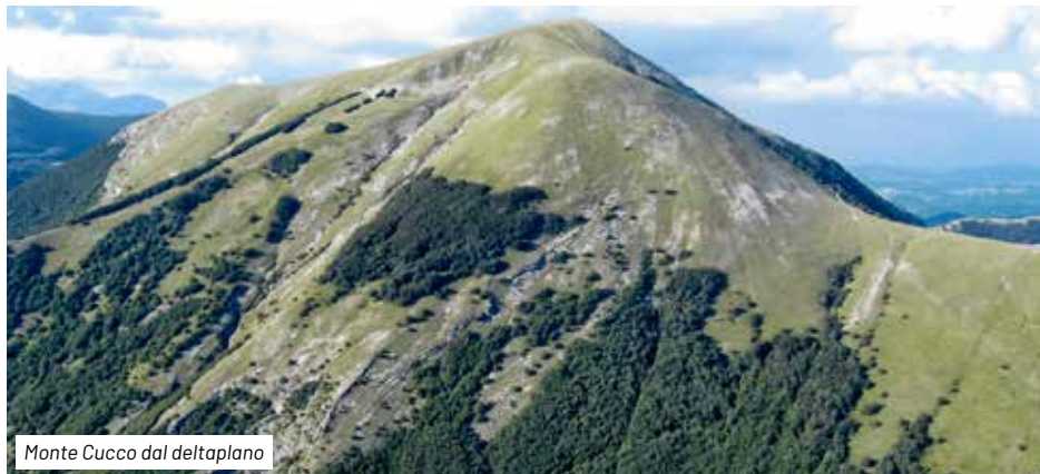
Monte Cucco dal deltaplano

Il sentiero piuttosto esposto, è inizialmente ricoperto da una cotica erbosa che scompare quando il substrato diviene povero e sempre più roccioso. E' in questi punti, poco prima della fonte Ghiacciata, che appaiono sulle rocce, dei bellissimi fossili, testimoni di una lunga ed affascinante storia geologica. Raccogliendo qualche pietra ed osservandola, appare composta da tanti minuscoli granelli bianchi ad involucri concentrici, detti ooliti: si tratta di sabbia carbonatica depositata sul fondo del mare